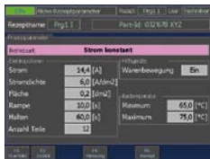
Prozessführung «Strom konstant»