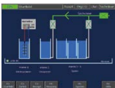
Touch Screen als Bedienpanel mit Prozesswanenübersicht

Die Anlagen werden kundenspezifisch hergestellt und den individuellen Bedürfnissen angepasst.