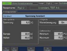
Prozessführung «Spannung konstant»